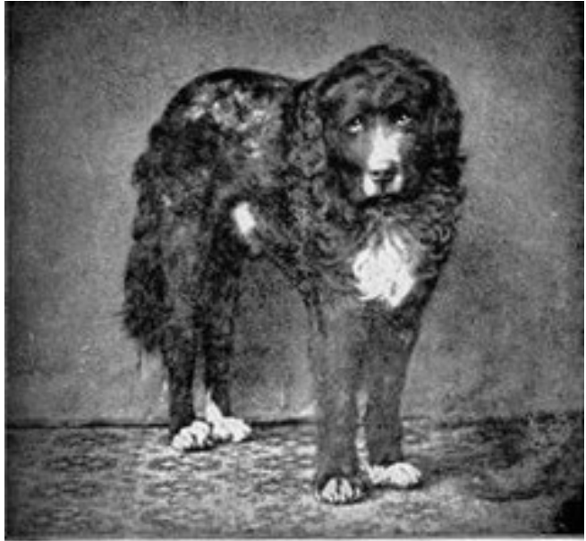
Richard Wagners Neufundländer Ruf begraben im Garten des Hauses Wahnfried: „Hier ruht und wacht Wagners Ruf.“