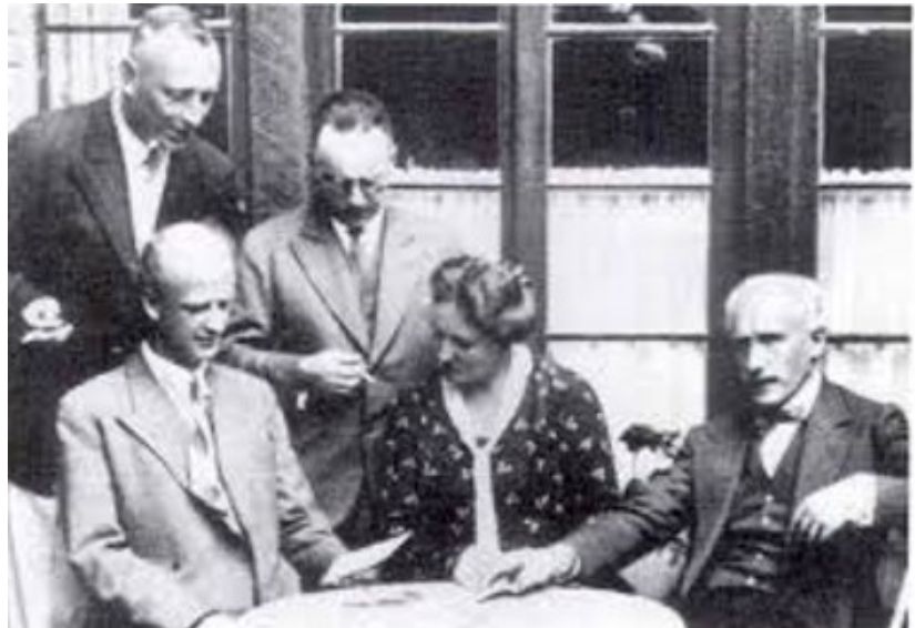
Vlnr zittend: Furtwängler, Winifred Wagner en Toscanini

Furtwängler weigerde zogenaamde Dynastie-werken te dirigeren en stond op Beethoven. Het werd de 3e symfonie. Dit lange werk liet weinig tijd over voor Toscanini. Hem werd alleen de Faust-ouverture