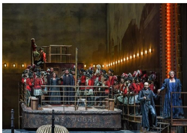
Scènefoto Götterdämmerung Düsseldorf; Hans J. Michel

werken van Thomas Mann als die van Wagner worden veelal verklaard vanuit een beeld dat, in de tijd gezien, pas achteraf is ontstaan. Weiher wees dit mechanisme af. Niet alles wat met een kunstwerk wordt gedaan of er van wordt gevonden, hoeft aan dat kunstwerk zelf te liggen. Het symposium werd afgesloten met een fragment van Visconti's film Der Tod in Venedig .