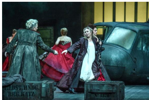
Scènefoto Die Walküre Düsseldorf